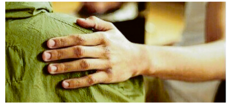
... meteen een warm welkom gekregen!