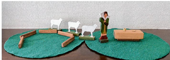
Wil jij Jezus leren kennen?